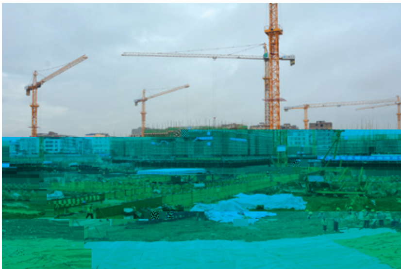
新港家园建设场面热火朝天

为加快办理前期手续，绿港集团采取专人、专职、专项经费等措施办理项目前期手续，加强部门之间的联系与协调，根据项目建设开工时间，倒排办理任务的时间节点，确保各项手续如期办结；为加快工程进度快，项目建设实施按照“一个项目部、一套管理制度、一抓到底”的模式加强管理，同时倒排工期，在确保质量与安全的前提下，如期、如质、如量地完成各项建设任务。