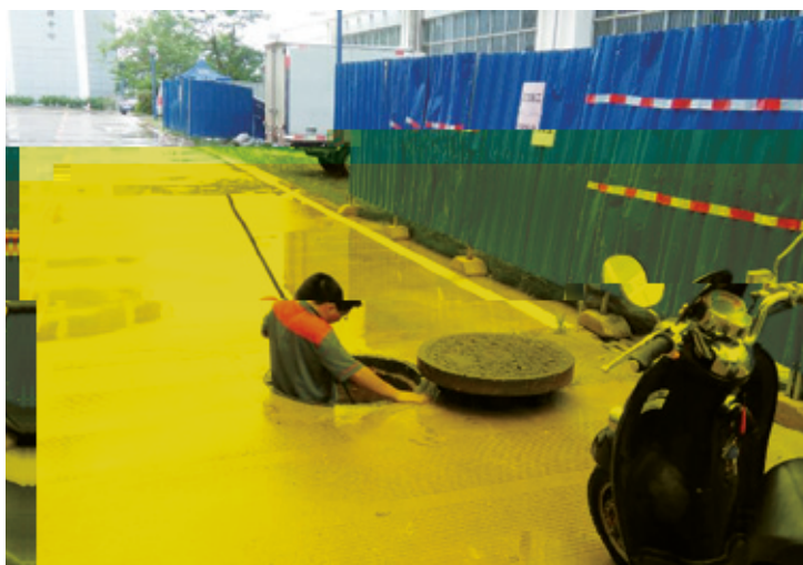
金凯工业园工作人员正在疏通管道

当天，万方物业安全管理领导小组成员到各园区进行巡查，指导做好防御工作通过层层落实责任人，把防御工作责任落实到服务中心办公室、班、组，全面落实