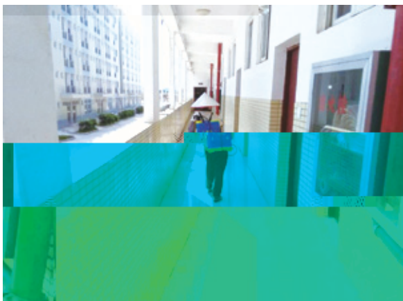
银凯孵化园工作人员正在对园区进行消毒

在万方物业全体人员的努力下，绿港集团各大园区在台风期间没有出现任何安全事故，确保了入驻企业人员及财产的安全，得到了经开区及集团公司领导的充分肯定。