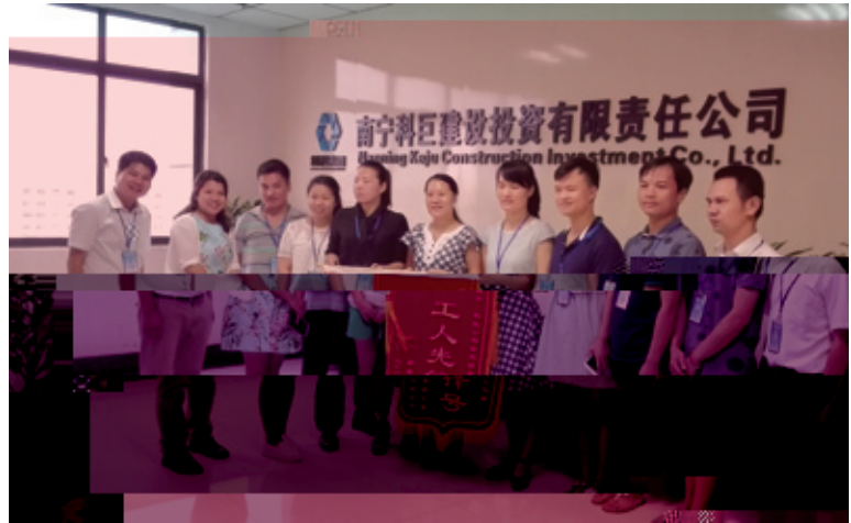
科巨公司清库工作组

随着任务分工的落实，解决方案的制定，工作组就任务主动提出问题并解决问题，及时协调沟通，相互鼓励，怀着“工作拿不下，坚决不撤离”的决心，大家逐渐进入了忘我的工作状态。