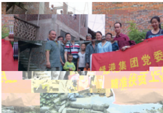
一线项目工作人员在流动书屋里选书

心开展精准扶贫工作。8月10日，派出专人到贫困村开展调研，深入了解精准扶贫工作的情况。8月12日，绿港集团党委书记、董事长、总经理杨东组织召开精准扶贫工作启动会，与各部门、各子公司签订《精准扶贫工作责任状》，将精准扶贫工作的具体