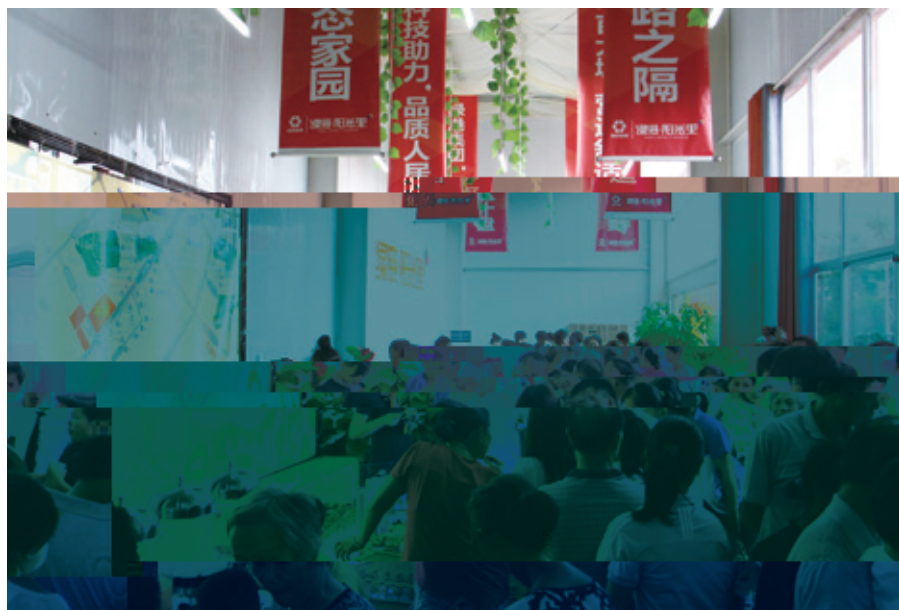
绿港·阳光里销售现场人气爆棚

发展大繁荣，凭借着国有企业固有的信誉品质和“百亿造城”的磅礴发展气势，在世界500强房地产开发企业林立的中国绿城南宁，犹如一颗冉冉升起的新星，见证着这座城市的发展与繁荣，贡献着“绿港铁军”的智慧与力量。经过2年多