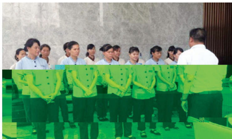
万方物业员工正在接受培训