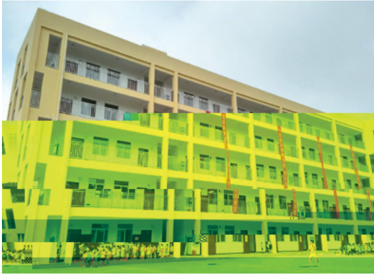
高岭小学综合楼项目

新房，在经开区管委会领导、绿港集团领导支持和关心下，科巨公司创新管理模式，本着质量第一、安全为本、效率至上的原则，积极打造亮点工程。业主代表充分发扬绿港集团“5+2”、“白加黑”精神，加班加点抢抓进度，攻坚克难，终于在9月1日开学前顺利